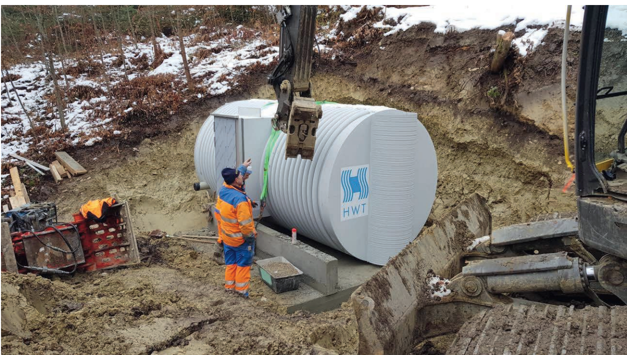
Montage der neuen Sammelbrunnstube