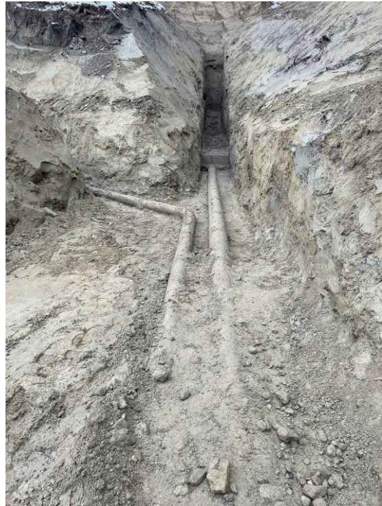
Fassung aus dem Jahr 1911