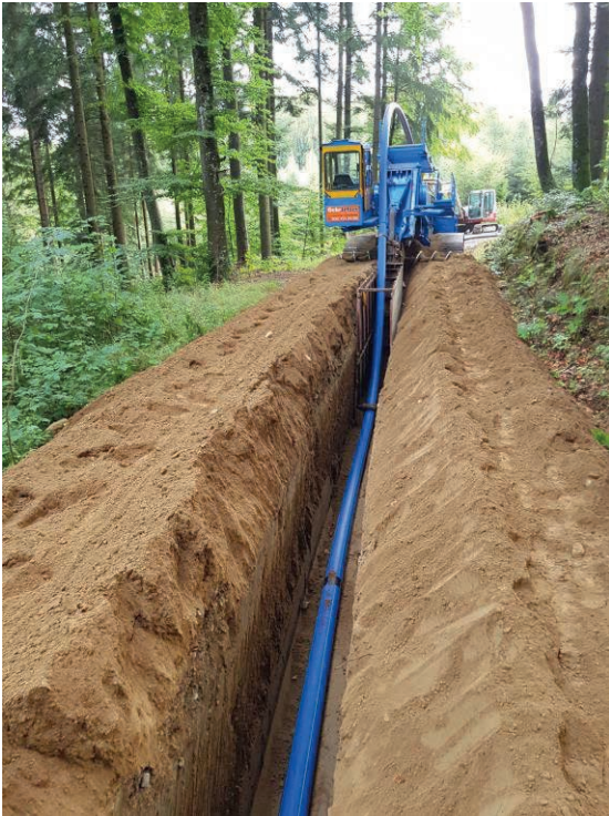
Leitungsbau im Wald mit Gräbenfräse

Nach dem Vorliegen der umfangreichen Baubewilligung und diversen Waldkäufen konnte im September 2020 mit dem Bau der Waldstrasse begonnen werden. Die meisten Fassungen waren noch in einem sehr guten Zustand, trotz ihres stolzen Alters von über 100 Jahren. Die Sanierungsarbeiten kommen gut voran und können im 2021 abgeschlossen werden. Anschliessend erfolgt eine Neuvermessung und Vermarkung der Parzellen und der Waldstrasse. Diese 1. Etappe der Sanierungen umfasst etwa 1/3 des Quellgebiets.