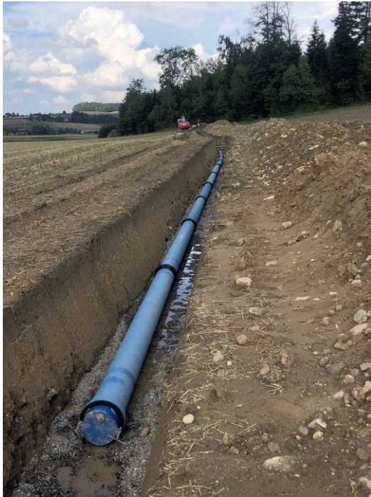
Leitungsbau Richtung Schwanden

Der Baustart erfolgte am 23.03.2020. Die Bauarbeiten verliefen ohne grössere Probleme und der Leitungsbau der über 4,5 Km konnte im Berichtsjahr fast vollständig abgeschlossen werden. Die Inbetriebnahme der Leitung erfolgt nach der Montage von zwei Schächten und den anschliessenden Desinfektionsarbeiten voraussichtlich im 1. Quartal 2021.