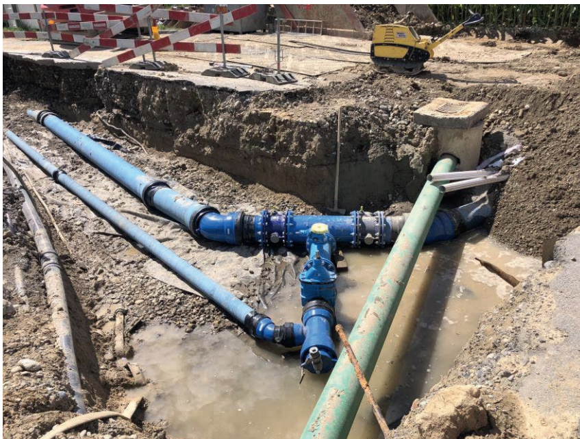
Zusammenschluss in Schwanden